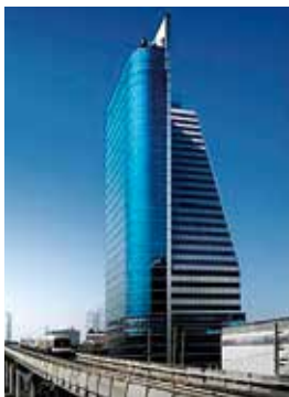
ITO (THAILAND) LTD. (タイ、バンコク)