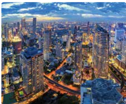
バンコクは ASEAN のハブ的役割を担う重要都市

伊東商会は、戦後、焼け野原となった東京の中心から復興の一翼を担おうと創立した企業です。メーカーとお客様を商品と情報で結び、ソリューションを提供し続けてきました。その歴史の基には、両者との間で築き上げられてきた信頼関係があります。それは当社の誇りであり、強みでもあります。