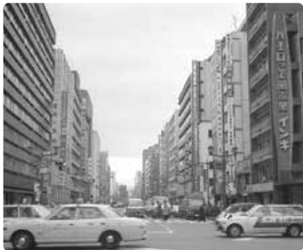
昭和 58 年の京橋の様子