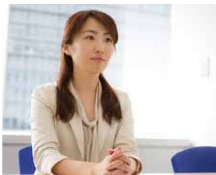
J-Win で培った知識を女性社員が活かせる企業環境

日本国内に 7 つある拠点の他、上海、深圳（中国）とバンコク（タイ）に当社の拠点・現地法人があります。低コストの仕入先としてのみならず、アジアを市場として事業展開するお客様のサポートも行っています。国内外の各拠点間で情報を共有することで、お客様への最適なソリューション提供に努めています。また当社は国際社会における日本企業の理解を深めるために、コーポレートスポンサーとして米国コロンビア大学ビジネス・スクール 日本経済経営研究所の活動にも貢献しています。