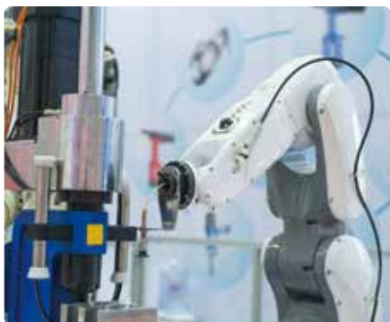
搬送系と連動する自動化システムも提供しています

また当社は NPO 法人 J-Win（ジャパン・ウィメンズ・イノベティブ・ネットワーク）の会員企業です。女性の積極的な登用を通してダイバーシティ・マネジメントの促進と定着を目指しています。